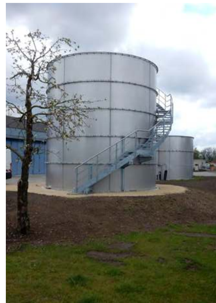
oben: Faultürme der Kläranlage Edenkoben