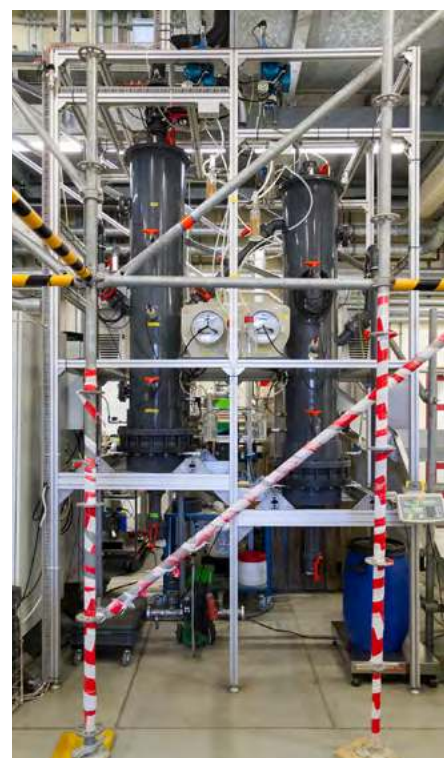
Vergärungsversuche im Labor- und Technikumsmaßstab