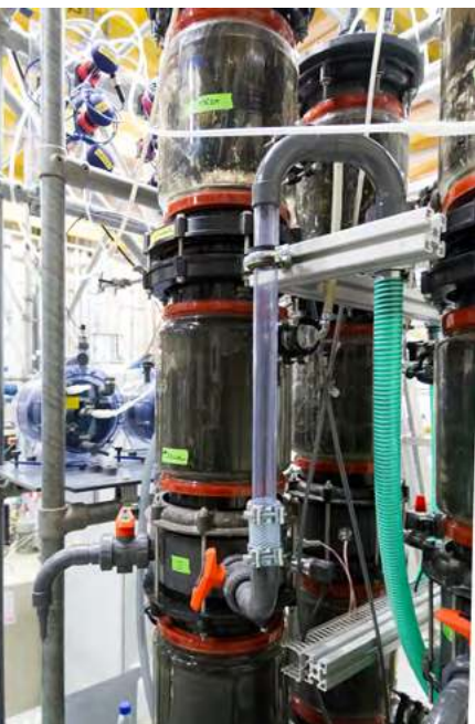
oben: Einstufige Anlage in Ilsfeld

Im Zuge der erhöhten Biogasproduktion reduziert die Hochlastfaulung auch den Gehalt an organischen Inhaltsstoffen – je nach spezifischer Verfahrenskombination um 50–70 Prozent. Der organische Anteil des Trockenrückstands beträgt nur noch weniger als 50 Prozent. Der Schlamm kann dadurch besser entwässert werden. So fallen weit geringere Schlamm mengen an, die günstig entsorgt werden können.