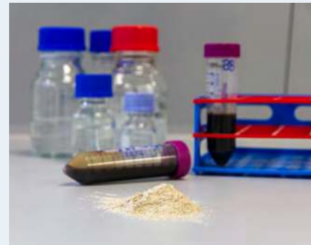
oben: Aus Abwasser zurückgewonnenes Struvit kann als langsam N und P freisetzender Dünger eingesetzt werden

Dieser Ansatz wird seit 2021 in dem von der EU und vom Land Baden-Württemberg geförderten Projekt »RoKka – Rohstoffquelle Klärschlamm und Klimaschutz auf Kläranlagen« verfolgt.