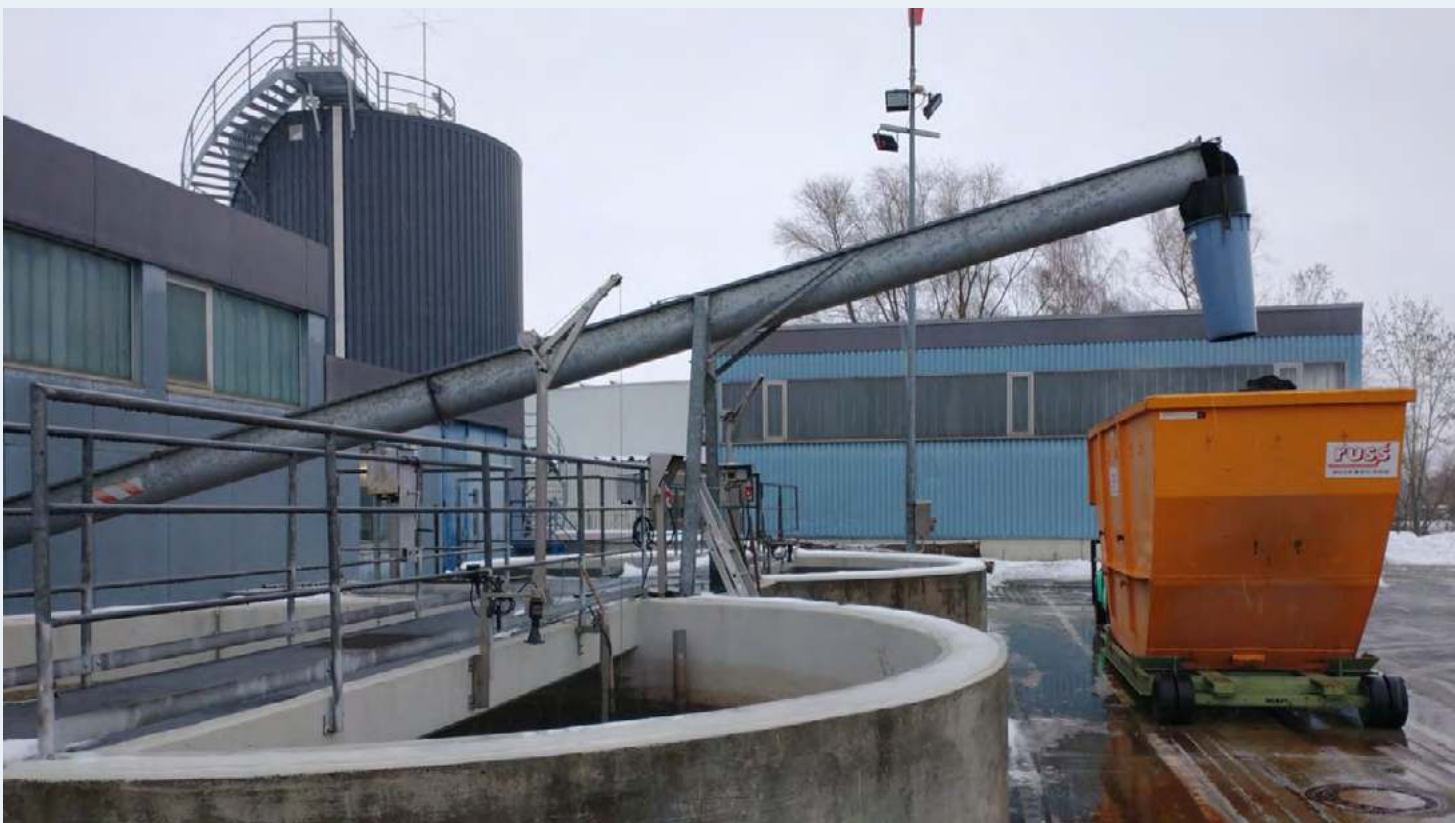
unten: Auf der Kläranlage Erbach wird im Projekt RoKka eine Pilotanlage der Abwasser-Bioraffinerie aufgebaut