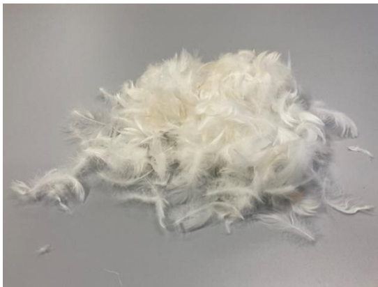
Abb. 1 Federn enthalten Keratin, ein wasserunlösliches Strukturprotein, aus dem sich Bestandteile von Klebstoffen herstellen lassen.