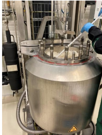
Abb. 3 Am Fraunhofer CBP wurde das Verfahren in einen größeren Maßstab skaliert und es wurden mehrere Kilogramm Hühnerfedern verarbeitet.

----- FORSCHUNG KOMPAKT 1. März 2024 || Seite 4 | 4 -----